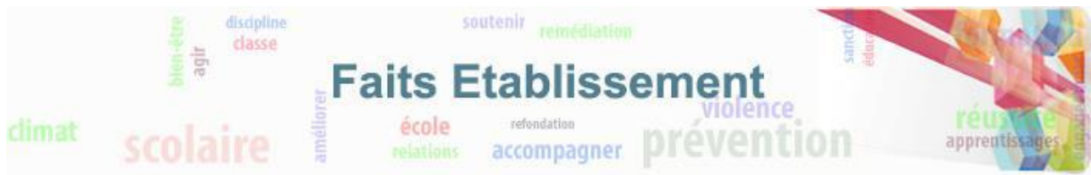
Figure 20 - Les exports