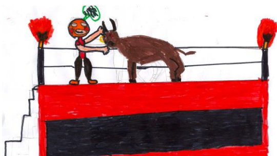
Prendre le taureau par les cornes.