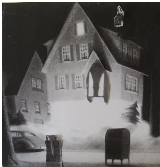
nouvelle image découlant de la recomposition